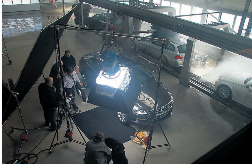
Während im Hintergrund an der 26 Meter langen Vorwaschstrasse Autos vorgereinigt werden, wird am Set konzentriert an einer Szene gearbeitet.

Am Samstag, 28. Februar, war in Emmen bei oscarwash.ch nichts wie sonst. Überall standen Technikwagen und grosse Scheinwerfer. Eine unzählige Menge von Leuten wuselten in alle Richtungen und waren sichtlich nicht zum Autowaschen gekommen. Die Neugier der Schaulustigen wurde schnell gestillt, ein freundlicher Mitarbeiter von oscarwash.ch liess