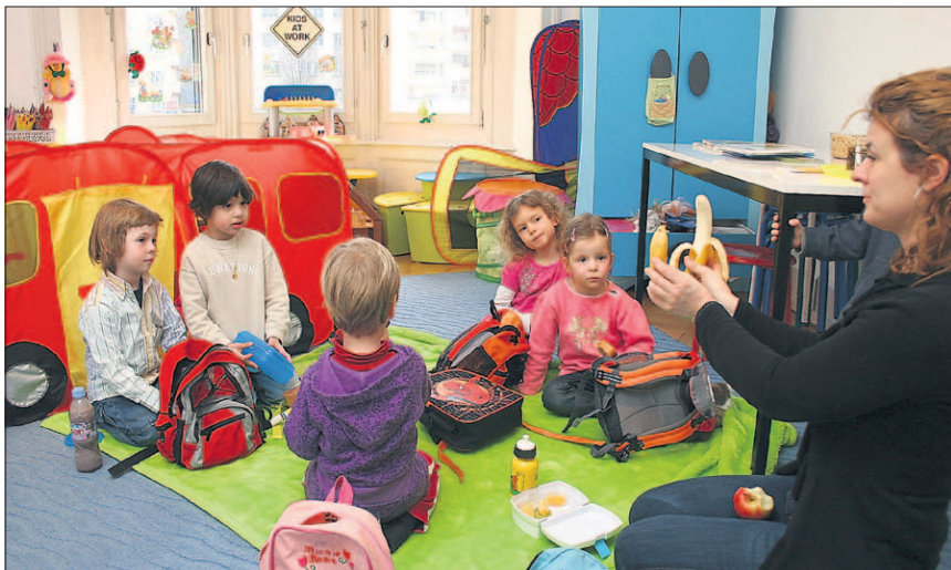
Nach der lustigen und spielerischen Englischlektion gönnt man sich ein Picknick. Selbstverständlich wird auch hier die ganze Zeit in der englischen Sprache miteinander geredet.

Am Samstag, 28. März, 13.30 bis 16.30 Uhr, lädt Funenglish zum Tag der offenen Tür ein. Funenglish bietet Englisch für Kinder im Spielgruppenalter (drei bis fünf Jahre) an. Ausserdem können Sechs- bis 13-Jährige während einer Stunde pro Woche die Sprache erlernen und 13- bis 18-jährige Jugendliche am Nachhilfeunterricht teilnehmen. Ausserdem können auch Erwachsene von verschiedenen Kursangeboten am Vor- und Nachmittag profitieren. Während der Sommerferien