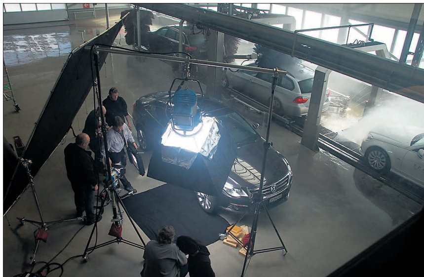
Während im Hintergrund an der 26 Meter langen Vorwaschstrasse Autos vorgereinigt werden, wird am Set konzentriert an einer Szene gearbeitet.

Am Samstag, 28. Februar, war in Emmen bei oscarwash.ch nichts wie sonst. Überall standen Technikwagen und grosse Scheinwerfer. Eine unzählige Menge von Leuten wuselten in alle Richtungen und waren sichtlich nicht zum Autowaschen gekommen. Die Neugier der Schaulustigen wurde schnell gestillt, ein freundlicher Mitarbeiter von oscarwash.ch liess