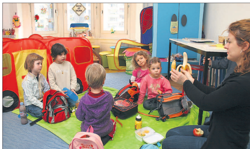
Nach der lustigen und spielerischen Englischlektion gönnt man sich ein Picknick. Selbstverständlich wird auch hier die ganze Zeit in der englischen Sprache miteinander geredet.

Am Samstag, 28. März, 13.30 bis 16.30 Uhr, lädt Funenglish zum Tag der offenen Tür ein. Funenglish bietet Englisch für Kinder im Spielgruppenalter (drei bis fünf Jahre) an. Ausserdem können Sechs- bis 13-Jährige während einer Stunde pro Woche die Sprache erlernen und 13- bis 18-jährige Jugendliche am Nachhilfeunterricht teilnehmen. Ausserdem können auch Erwachsene von verschiedenen Kursangeboten am Vor- und Nachmittag profitieren. Während der Sommerferien