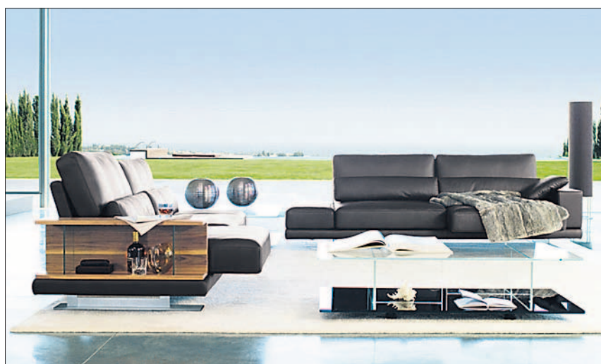
Eine Vielfalt an bequemen Polstermöbeln stehen zum Probesitzen bereit. Rolf Benz bietet mit seiner neuen Sitzlandschaft Vida ungeahnte Gestaltungsmöglichkeiten.

Zum Frühjahrsstart zeigt Möbel Schaller in der umgebauten Wohnschau in Geuensee die neusten Design- und Wohntrends aus der Kollektion 2009. Kreative Einrichtungsideen in edlen Materialien und erstklassigem Design erwarten die Besucher. Zu erleben sind die attraktiven Modelle der bekanntesten Möbelmarken und exklusive Neuheiten aus europäischen Möbelmanufakturen. Einzigartige Wohnwandsysteme von Pressotto mit Natursteinfronten in italienischem